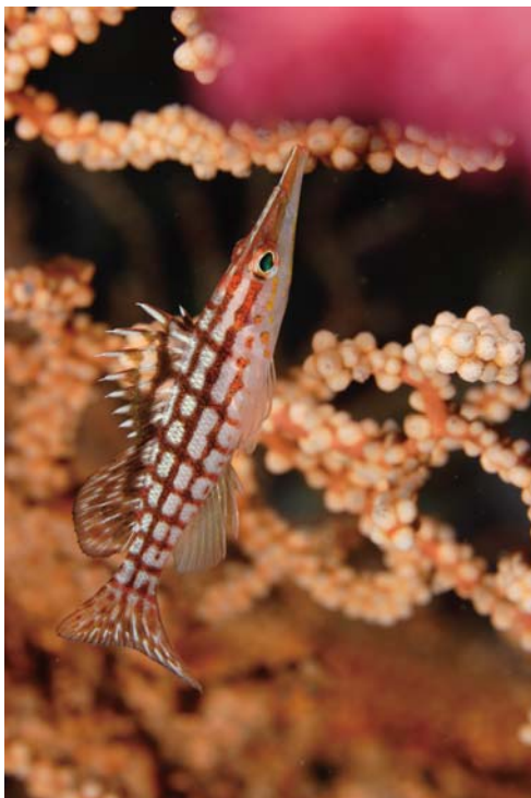
EF-S60mm F2.8マクロUSM 作例 被写体: クダゴンベyg(約36cm) 撮影地: 伊豆大島・秋の浜・-35m 撮影距離: 約6cm Z-240×2ft