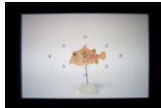
ストレートビューファインダー(*1)/45°ビューファインダー使用イメージ