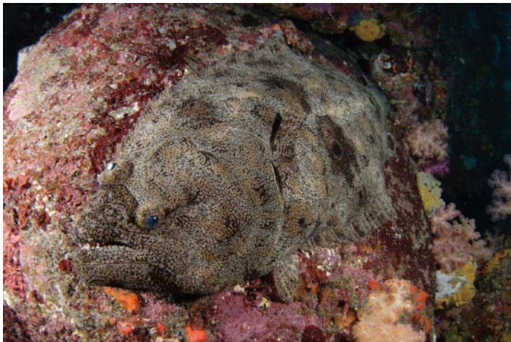
AT-X 107 DX フィッシュアイ ワイド端(10mm) 作例 撮影地: 伊豆大島・秋の浜・-30m 被写体: ヒラメ(約80cm) 撮影距離: 約12cm Z-240×2ft

(*3) 絞り開放側で画像周辺部の画質が劣化する可能性があります。絞ってご使用下さい。 (*4) ズームワイド端/絞り開放側で画像周辺部の画質が劣化する可能性があります。絞ってご使用下さい。 (*5) ズーム操作のみ可能。マニュアルフォーカス操作を行うことは出来ません。