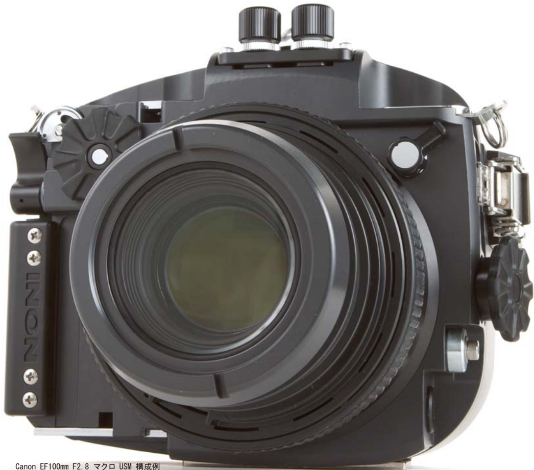
Canon EF100mm F2.8 マクロ USM 構成例