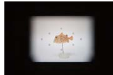
ピックアップファインダー使用イメージ