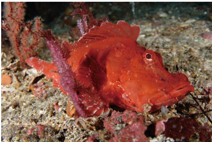
AT-X 107 DX フィッシュアイ テレ端(17mm) 作例  撮影地: 伊豆大島・秋の浜・-40m 被写体: ニセハカサコ(約25cm) 撮影距離: 約6cm Z-240×2ft