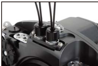
光Dコネクタ部拡大画像(4灯構成時)