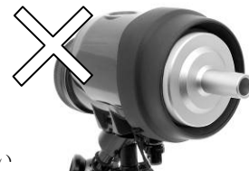
スラストチューブを使う場合は、ラバーフードを折りたたまない