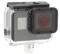
「水深 15m 以浅用」セット時