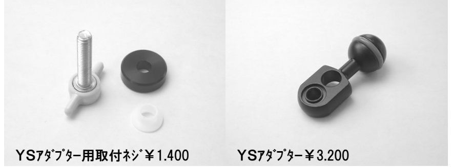
YS7アダプター用取付ネジ ¥1.400