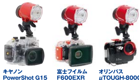
キヤノン PowerShot G15