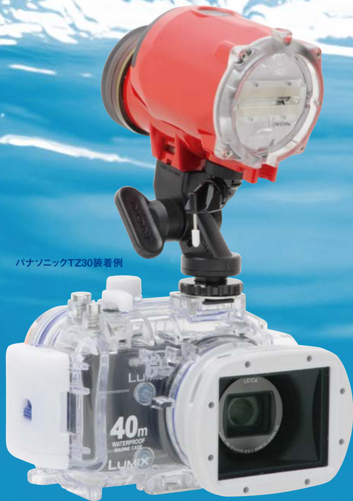
パナソニックTZ30装着例

コンパクトでありながらも驚くべきハイパフォーマンスを持ち、ワイヤレス S-TTL 自動調光機能を搭載したストロボ「S-2000」。このインonstrロボを、「シューベースセット」を介して、コンパクトデジカメの防水ハウジングに直接取り付けるだけの簡単セッティングで、ストロボ撮影を楽しめるようになりました。カメラを気軽に片手で持って、外部ストロボの余裕のパワーで水中世界をより鮮やかに写し出せます。機材が大きくなるからと、ストロボの購入をためらっていた方々に最適な「はじめるパックSB」で、ワンランク上の水中撮影をはじめましょう。