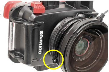
ロック完了時のストラップ取付部の位置