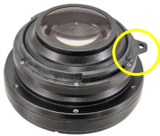
ストラップ取付部