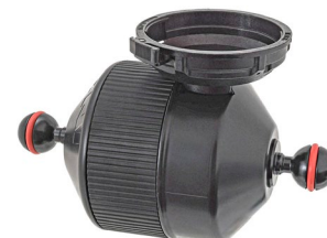
レンズホルダー装着イメージ