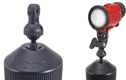
YS ボールアダプター装着イメージ